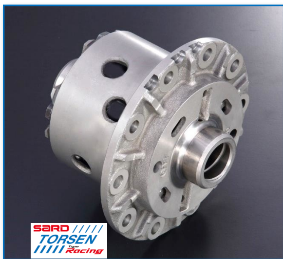
< SARD TORSEN Type Racing >