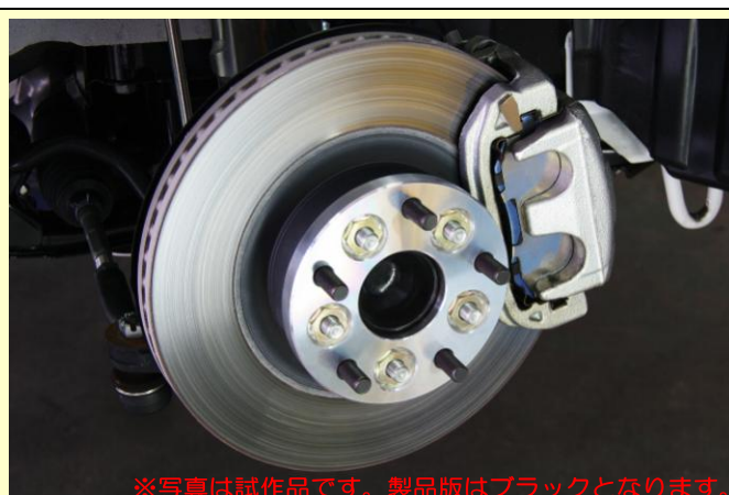
※写真は試作品です。製品版はブラックとなります。