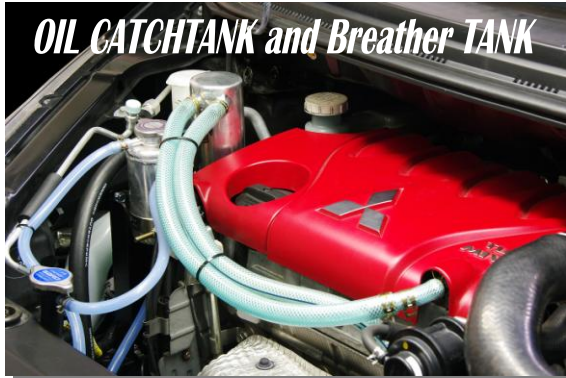
OIL CATCHTANK and Breather TANK