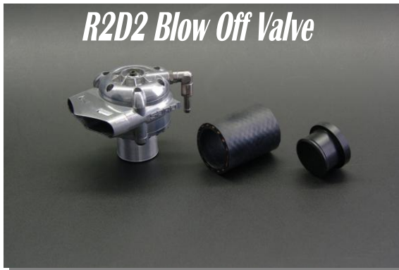
R2D2 Blow Off Valve